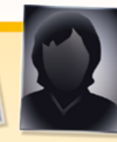
Stadtteil: Eversburg Mobil: 0160 98144714